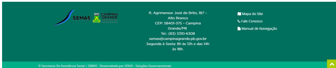
Figura 8 – Rodapé

No rodapé é disponibilizado o mapa do site, com todos os menus, acessos e seus respectivos links. Além disso, no rodapé também é disponibilizado a logomarca do ente, informações de localização e contato.