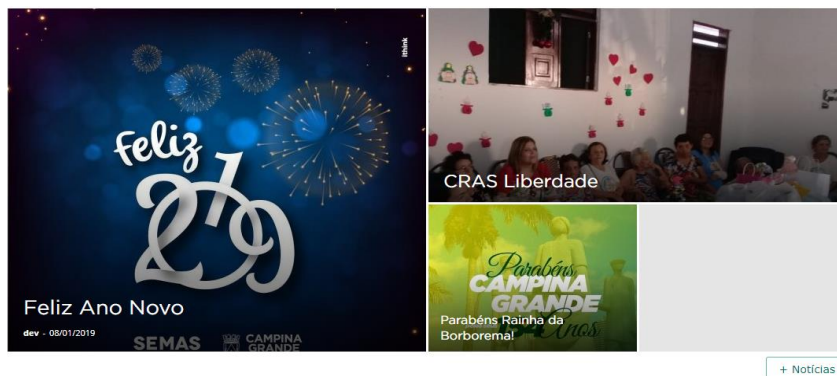
Figura 4 – Módulo de Notícias

O módulo de notícias é onde ficam disponibilizadas as notícias mais recentes postadas no site. As notícias postadas se referem a atos da gestão do ente ou divulgação de prestação de algum serviço.